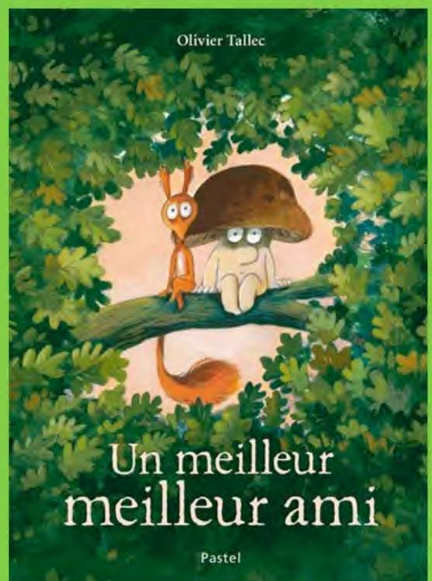
Un meilleur meilleur ami album