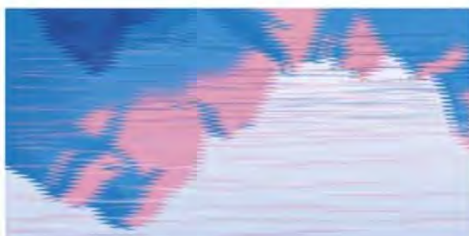
Le smoking des orques roman