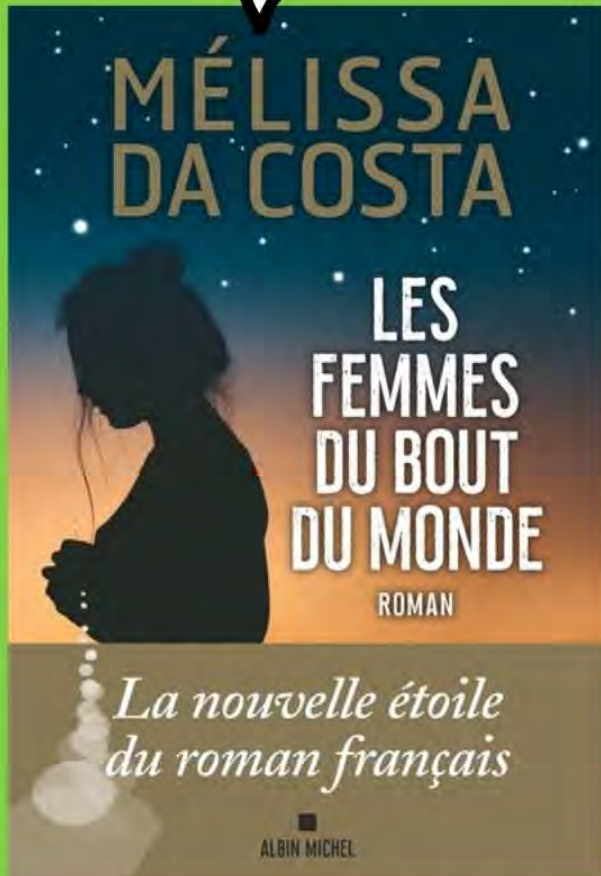
Les femmes du bout du monde roman

Si tu te demandes ce que nous faisons ainsi, loin des hommes, je vais te dire : nous veillons sur notre petit univers, nous veillons les unes sur les autres. C'est ce que font les femmes du bout du monde.