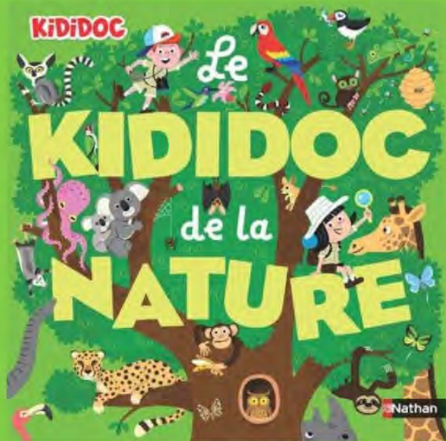
Kididoc de la nature documentaire jeunesse

Une plongée dans la diversité de paysages afin de sensibiliser les enfants à l'incroyable richesse de notre planète, à la biodiversité et aux mille secrets qu'elle recèle. Sur chaque double page, plusieurs animations pour s'émerveiller devant la beauté des formes et des couleurs de la nature, mais aussi pour comprendre le fonctionnement des différents milieux et de leurs habitants, qui forment un équilibre fragile et fascinant.